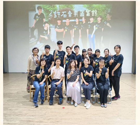
讀劇團隊於許石音樂圖書館成功演出2022台南文學獎首獎劇本《彼年的蝴蝶》。