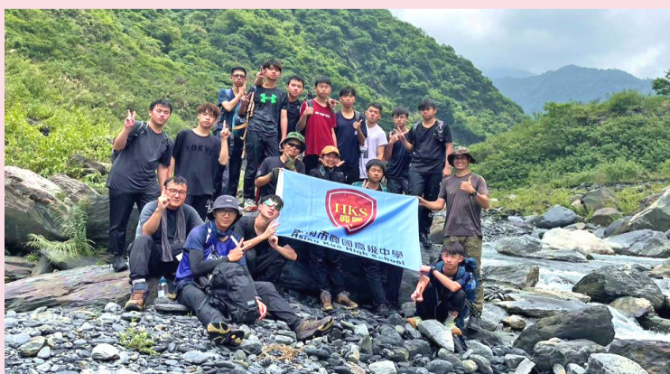
本校舉辦三天的山野教育期末驗收課程，師生順利完成穿越叢林的挑戰，相當難得。