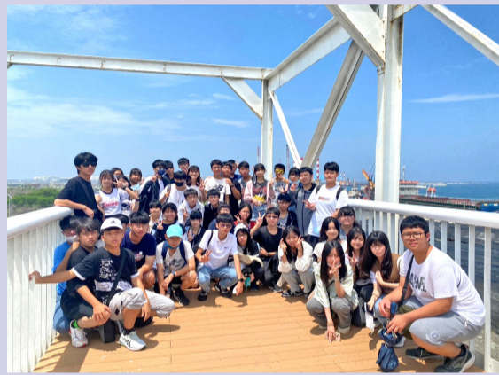
本校國三學生搭乘「高雄文化遊艇」到紅毛港文化園區，參觀有400年文史底蘊的紅毛港。

「走讀高雄」最後一站來到高雄著名的駁二藝術特區，這裡曾經是高雄的舊港區，如今保留了许多歷史建築和港口設施，並將其改建為一個融合藝術、設計、文化和創意產業的場域。