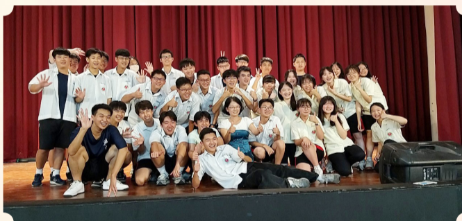
興國高中英語創意歌曲比賽由高一5班拿下年度大賞獎。

本校致力培養學生多元創造力和表達能力，每年舉辦「英語創意歌曲比賽」，鼓勵學生在英語學習中發揮創意，也能藉此提升學生音樂素養，增進自我表達能力與舞台自信，今